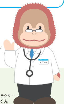
イメージキャラクター オランくん